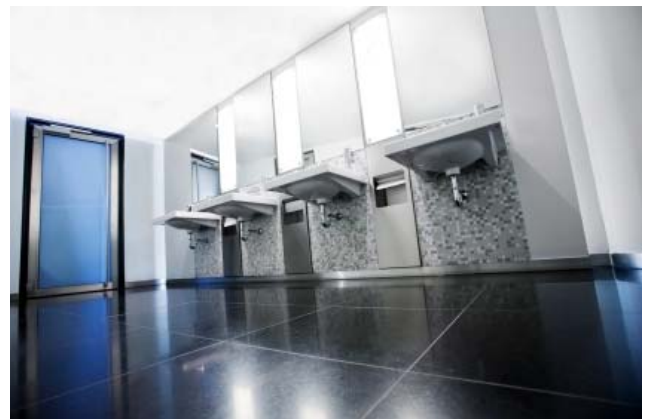
KUVA 1: PUHDAS WC ON VIHITYISÄ